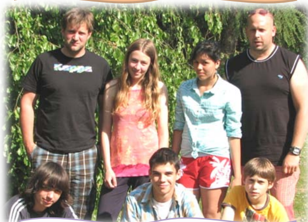
Dětský domov Zábřeh