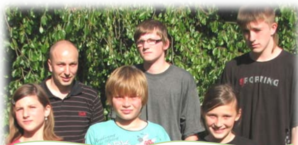
Dětský domov Konice

S projektem jsme začali v listopadu 2010 a skončili v červnu 2012; celkem jsme na projektu pracovali 20 měsíců.