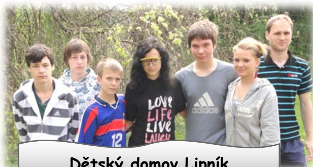
Dětský domov Lipník