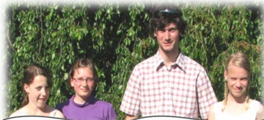
Dětský domov Hranice