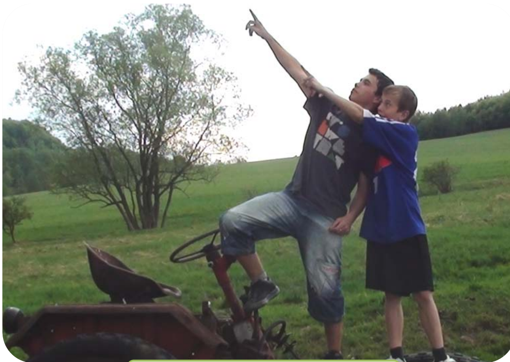
Naše hvězdy míří ke hvězdám