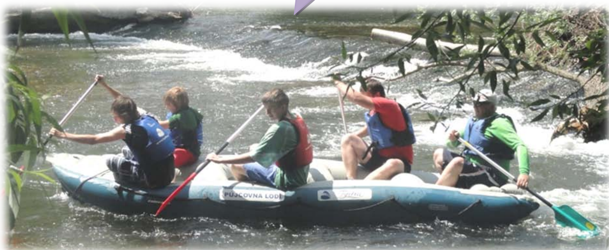
Raftáci na divoké řece Moravě - až WW-5!

A JDEME DO FINÁLE - RAFTING, KASINO, FILMY A NAKONEC KONEC VE VÁCLAVOVĚ