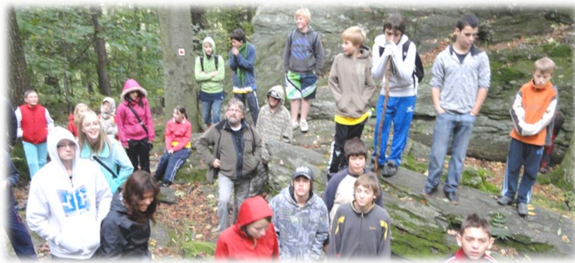
Jdeme dobýt už dobytý hrad Rabštejn