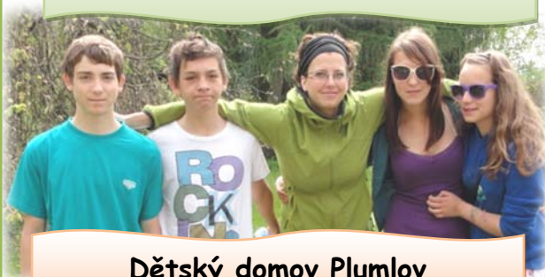
Dětský domov Plumlov